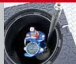
Kupplungsrohrschlüssel mit Nuss zur Höhenanpassung