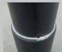
PE-Teleskopschutzrohr mit Sicherungsklemming