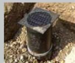
Einbau des FLEX Unterflurhydrants